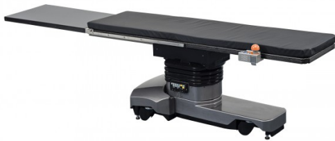
Table rallonge pour support cathéter pour CMAXRAY & GTOPVS